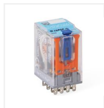
C9A4124A (EL4378502) Miniaturrelé QRC 4-pol 5A 24V AC