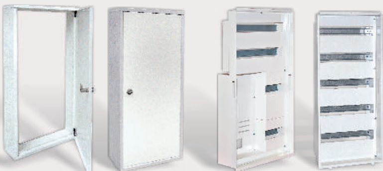
EKS. PÅ FRONT MED DØR / VEGGER

- ganske enkelt; en smart og fleksibel løsning!