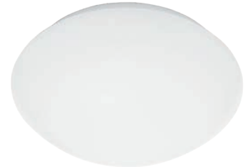
P2, Ø 320 mm 1674 lm/3000K | 1731 lm/4000K