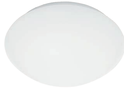
P3, Ø 400 mm 2210 lm/3000K | 2310 lm/4000K