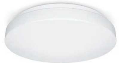
P2 Flat, Ø 322 mm 1608 lm/3000K | 1700 lm/4000K