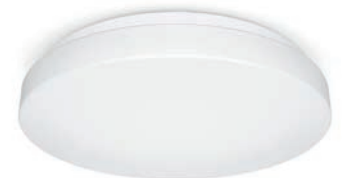
P1 Flat, Ø 272 mm 942 lm/3000K | 965 lm/4000K