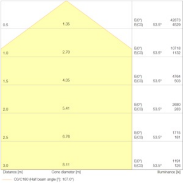
LDC typ cone