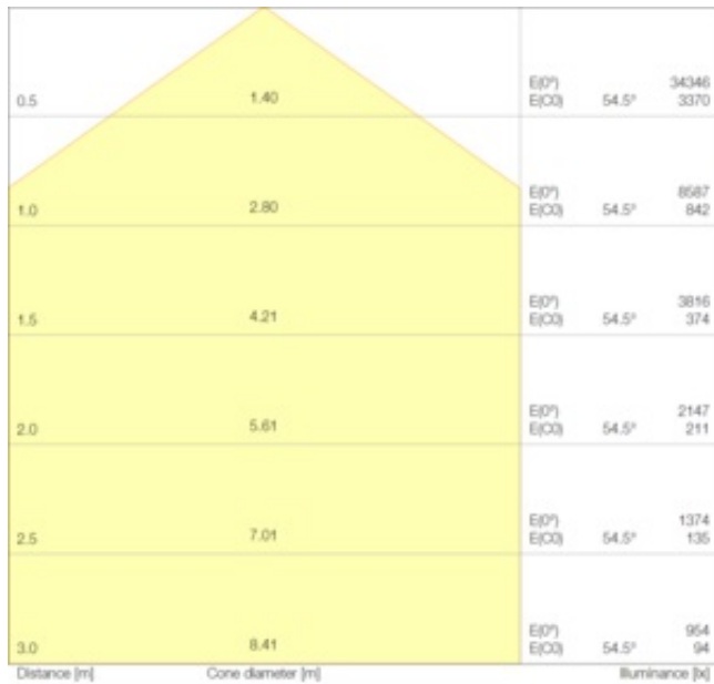
LDC typ cone