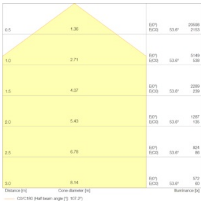
LDC typ cone