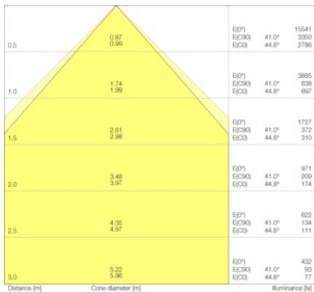
LDC typ cone