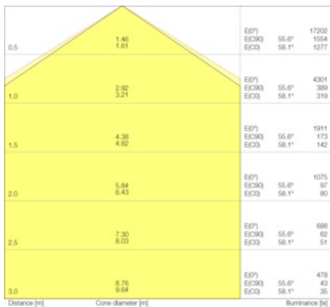
LDC typ cone