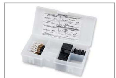
UniCam kontakter i 25stk forpakning