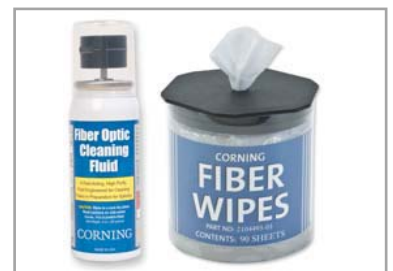
Fiber rensesveske og Lo-frie kluter for UniCam