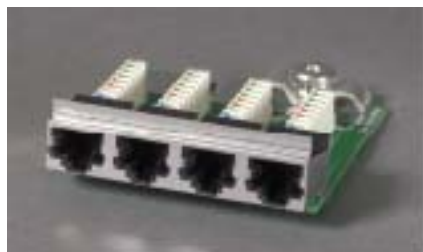
4-ports modul STP