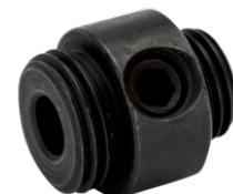
Størrelsesadapter for forstørrelse av eksisterende hull 3834-UPSIZE