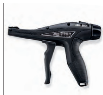
EVO7 med ny TLC-teknologi: maksimum ytelse med minimalt kraftbruk.

Alle dimensjoner i mm. Med forbehold om tekniske endringer.