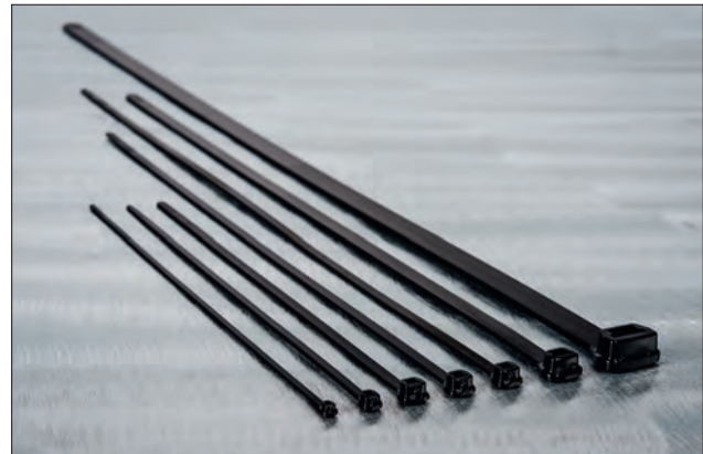
Buntebånd i X-serien.