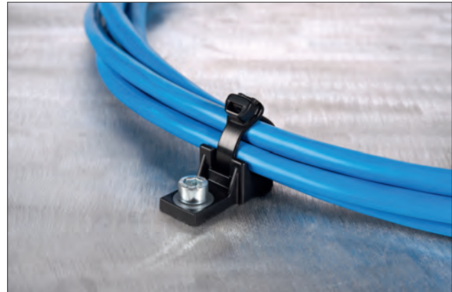
X-serien: en optimal festeløsning med lav byggehøyde.