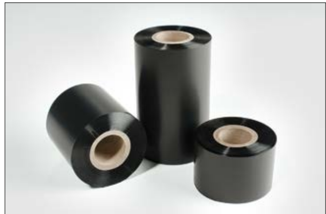
Folie for utskrift på krympeslange og TIPTAGs.