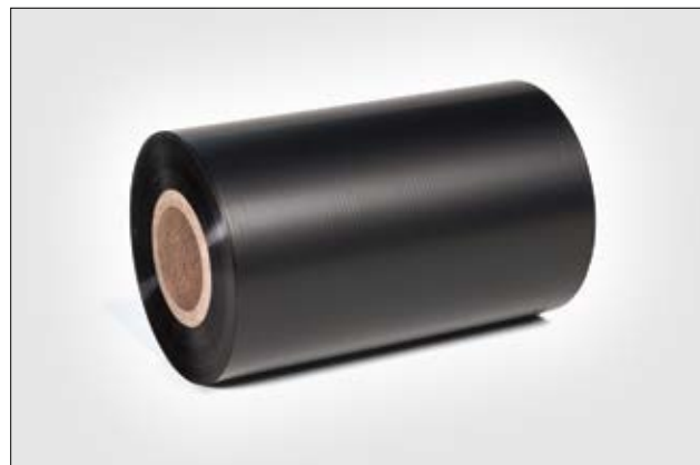
Folie for utskrift på etiketter.