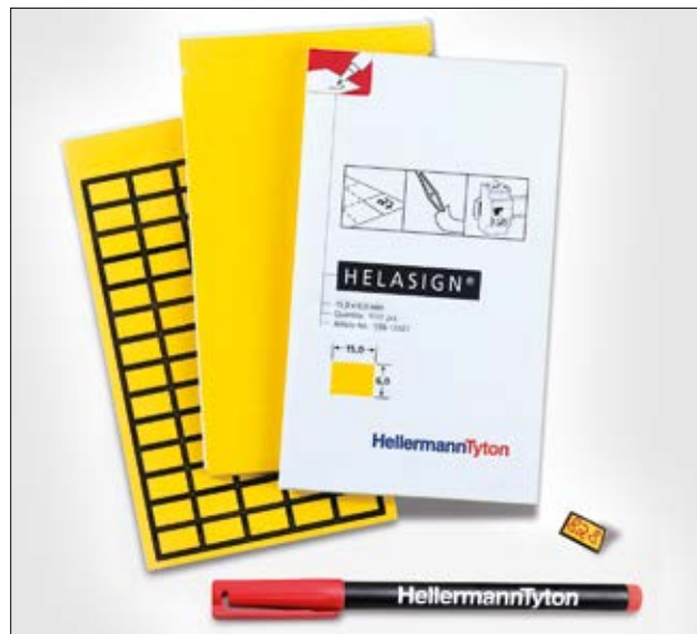
Alltid for hånden: etiketter i en hendig liten bok i lommeformat.