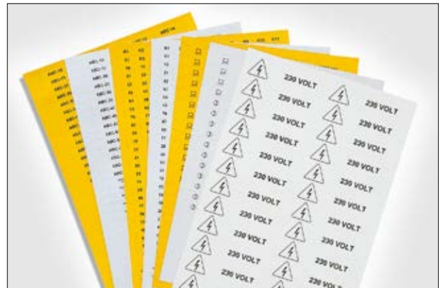
Helafix, holdbar og godt synlig merking.