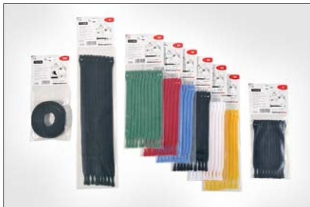
Serie TEXTIE er tilgjengelig i flere farger og lengder.