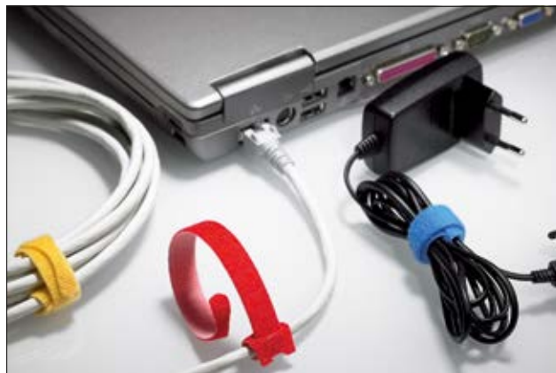
Takket være det presise designet, løsner ikke TEXTIE fra kabelbunten.