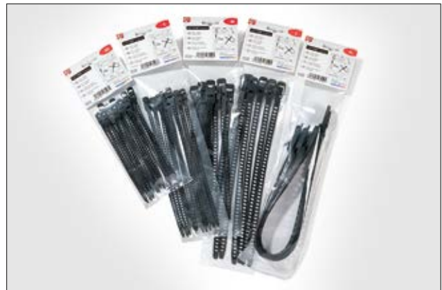
SOFTFIX buntebånd kan leveres i små forpakninger.