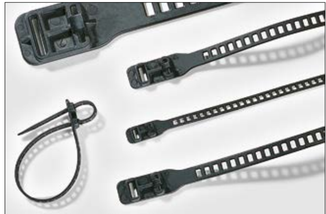
Elastisiteten i SOFTFIX-båndene gjør dem velegnet til en rekke formål.

Nyhet: med 2 løkker for parallellbunting!