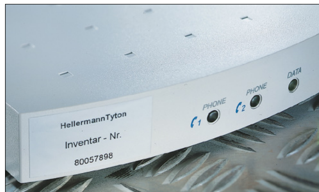
Helatag etikett for permanent merking av gjenstander.