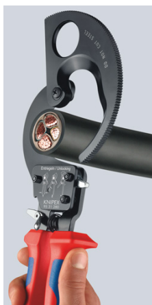
95 31 280: stor kapasitet: maks. Ø 52 mm /380 mm 2