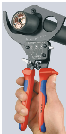
Skralleprinsipp og togangs tannkransdrift for kraftsparende skjæring