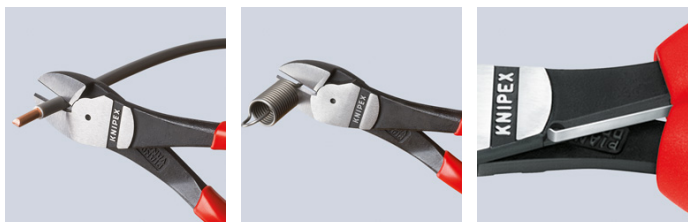
74 12: åpningsfjær i deaktivert posisjon