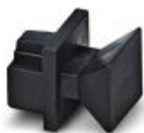
Støvbeskyttelseshetter for RJ45-bøsning

Støvbeskyttelse - FL RJ45 PROTECT CAP - 2832991