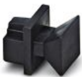
Støvbekyttelseshetter for RJ45-bøssing

Støvbekyttelse - FL RJ45 PROTECT CAP - 2832991