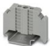
Endeholder, bredde: 9,5 mm, farge: Grå