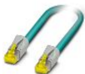
Patchkabel, CAT6 A , fire par, skjermet, ikke krysset forbindelse (Line), prefabrikkert på begge sider med RJ45/IP20-pluggforbindere, material yttermantel PUR, lengde 3,0 m

Patchkabel - NBC-R4AC/10G-R4AC/10G-94F/3,0 - 1408365