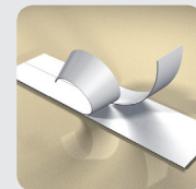
Splittet underlag som er enkelt å fjerne

I innlegg og andre bruksområder der de ikke behøver å limes på