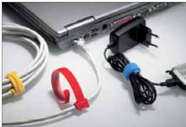
Da TEXTIE® leveres i et stort utvalg farger, er disse båndene ideelle også til kabelmerking.

Ettersom kabler med meget tynn og myk isolasjon blir mer og mer vanlig, øker behovet for en „myk“ buntemetode. TEXTIEs er ideelle til bruk på telefonkabler, optiske fibre og nettverkskabler opp til Klasse 6. Også ideelle til bruk i midlertidige installasjoner som f.eks teaterscener, konstruksjon eller prototypeproduksjon av kabelmatter.