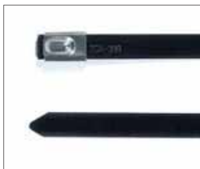
MBTS, MBTH med belegg.

Vi kan også levere åpningsbare stålbånd, type MLT - mer info i vår hovedkatalog.