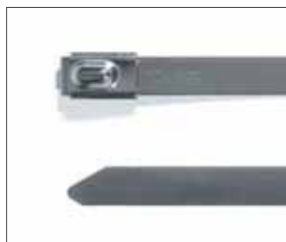
MBTS, MBTH uten belegg.