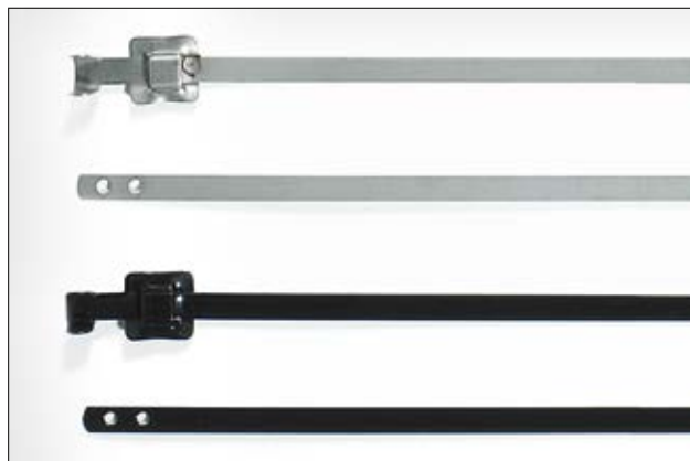
Serie MLT er åpningsbare stålband, og leveres med og uten belegg.

i Serie MLT (bredde opp til 10 mm) kan benyttes i kombinasjon med P-mounts i rustfritt stål. P-Mounts er enkle å installere med skrue eller bolt, og er en pålitelig festeløsning. Se side 149.