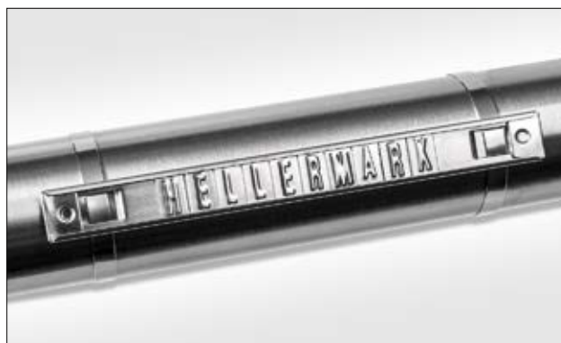
Hellermark SSC skinner og SSM merker.

Forbehold om tekniske endringer. Minimum ordremengde (MOQ) kan variere fra pakkestørrelse. Andre pakkestørrelser kan også være tilgjengelige. Minimum ordremengde (MOQ) kan variere fra pakkestørrelse. Andre pakkestørrelser kan også være tilgjengelige.