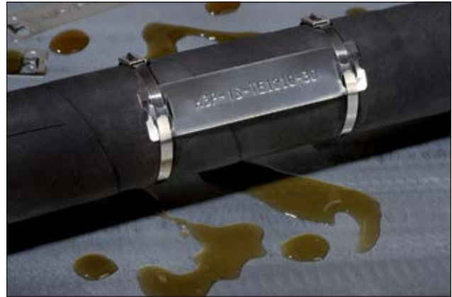
Merkesystem for krevende omgivelser: M-BOSS Compact stålmerker.