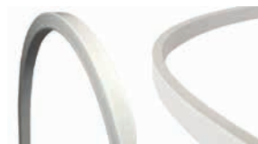
LED Neon F22A