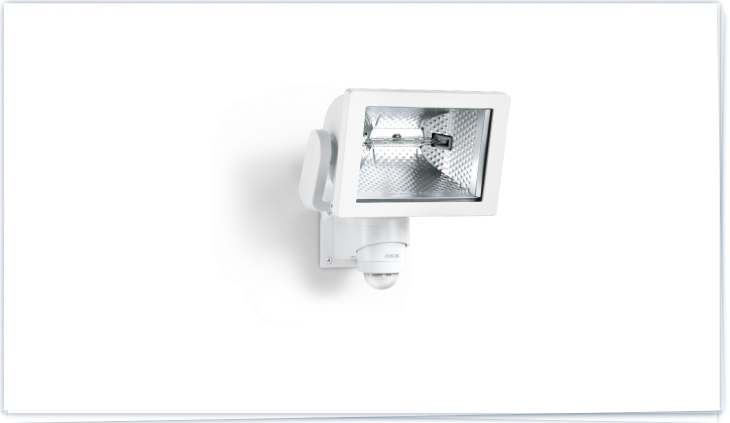
HS 500 DUO HVIT