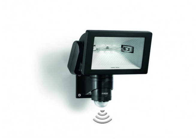
HS 300 DUO SORT