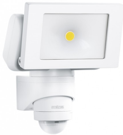
LS 150 LED HVIT