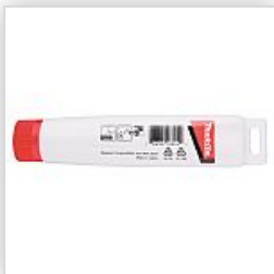
196804-7 HAMMERFETT 95ML