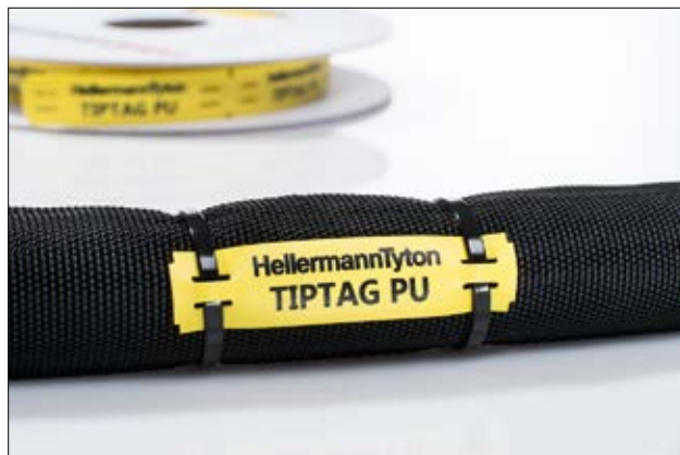
Holdbar merking for krevende omgivelser.