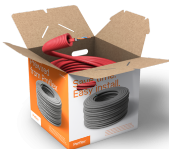
16 mm / ELQYB 2x1 / R100