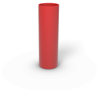
Skarvmuff 16 mm RD