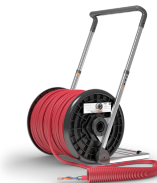
16 mm / ELQYB 2x1 / B300