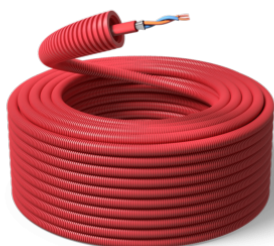
16 mm / ELQYB 2x1 / R100