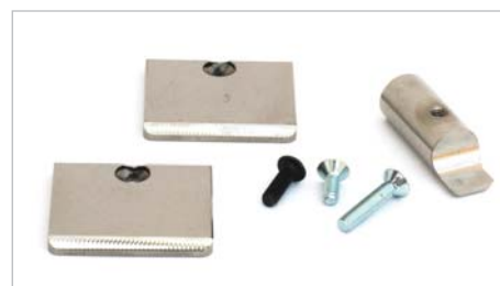
8800494 – Føringsplatesett