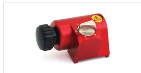
8800493 – Knivholdertønne