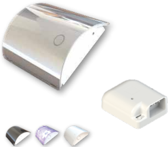
Skins gir valgfritt design/farge