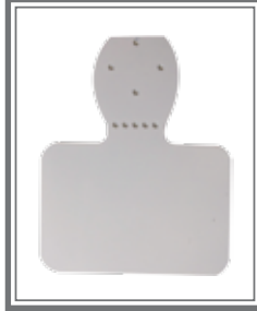
Liten og stor brakett