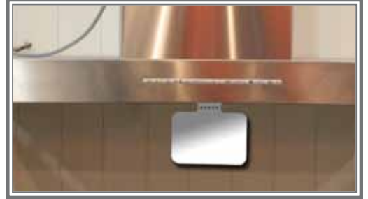
Festes i bakre del av ventilatorhette innenfor komfyrens område