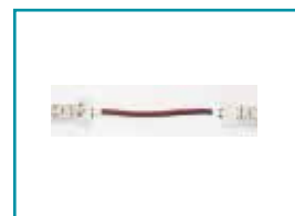
20 cm Skjøtekontakt El nr: 32 548 19